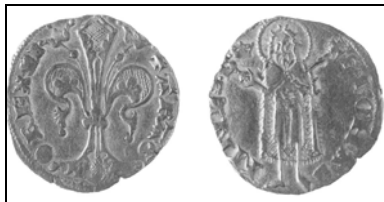
Florín de Martín II 1396-1410. Valencia.

Tanto en historia como en numismática los hechos se encadenan, a veces pausadamente, otras veces rápidamente, pero, en definitiva, siempre siguen una pauta que no puede soslayarse. La mejor moneda es la que priva. Y la metrología de las monedas, en la Edad Media, depende del área en la cual se comercia y/o se vive. En Catalunya, incluyendo Perpinyà y Montpeller, en Aragón y en Valencia, es decir, en la señoría del rey de Aragón, y en Castilla y León, las pautas metrológicas vienen dadas, en el metal, por la moneda andalusí y, en el peso, por el marco de Colonia 1 , de uso general con diversos nombres, su origen árabe, como ya sabemos, aceptado en el área cristiana como patrón para la acuñación de moneda de peso igual a la moneda andalusí y también como peso comercial en el área castellana, puesto que dos marcos de éstos completan una libra o un ratl .