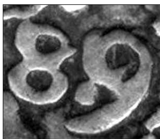
Fig. 7.- Detalle de la fecha donde se aprecia la rectificación del último número (cat. 7.1).

A falta de una identificación precisa de cuños, esto nos hace plantearnos la hipótesis de que realmente no se retoma de nuevo esa leyenda, sino que lo que se hace es reutilizar los cuños de anverso de los años 1684 a 1689. Esto vendría también refrendado por el hecho de que durante el reinado siguiente en la ceca se labran nuevos cuños para los dihuités , con representación del busto del monarca totalmente diferente a los anteriores, pero se conserva la leyenda del tipo CAROLVS·D·G·HISPAN·REX.