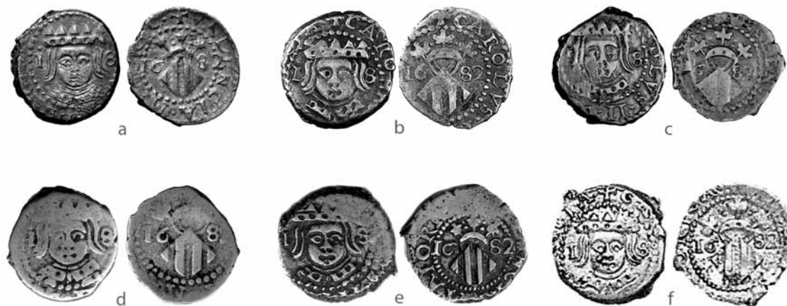
Fig. 9.- Dihuités con indicación de valor utilizados para el estudio. Cat. 2.1 (a) Col. CB; (b) Col. CM; (c) Col. CVB; (d) Col. CM; (e) Col. CM; (f) Petit 1981, n° 306.