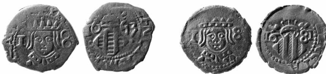
Fig. 6.- Dihuités pertenecientes al tesoro de la calle Fos (Ayuntamiento de Valencia), correspondientes a los años 1653 y 1681, en los que se puede observar la gran similitud en la manera de representar el busto del rey.

Finalmente, en un último intento de mejorar las piezas, se labró un nuevo cuño de anverso, ajustado al pequeño módulo, y sin la indicación del valor. En esta tercera variante ya se vislumbra el que será el nuevo estilo de representar al monarca durante el periodo 1684-1689 (cat. 2.2). Estos ejemplares del año 1682, y sin la indicación del valor en el anverso, han sido considerados tradicionalmente como medios reales o novenets , tema que se tratará más adelante.