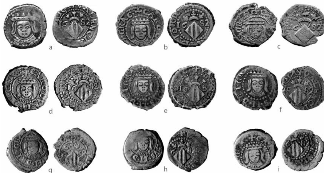
Fig. 8.- Dihuités sin indicación de valor utilizados para el estudio: cat. 2.3 (a) Col. CB; cat. 2.2 (b) Col. CB; (c) Col. CM; (d) Col. CVV; (e) Col. ALM; (f) Col. ALM; (g) GNC n° 2064; (h) GNC n° 10.873; (i) GNC n° 2089 (g, h, i © MNAC, Museu Nacional d'Art de Catalunya , Barcelona. Fotografos: Jordi Calveras, Marta Mérida, Joan Sagristà).