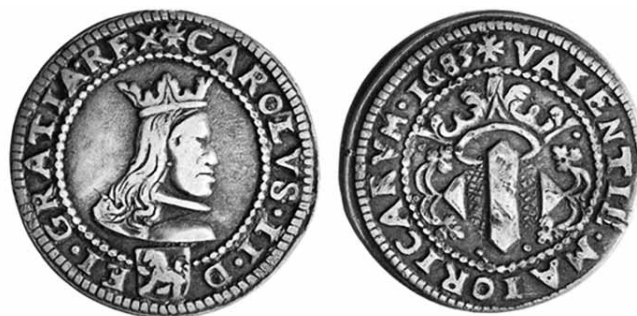
Fig. 4.- Doble real 1683 acuñado a molino (cat. 15).

El hecho de la realización de estas labras a molino, junto con el intento de recuperación del valor del doble real, también realizada a molino, se convierte claramente en un intento de devolver a la plata valenciana el prestigio que tuvo antaño, claramente desprestigiada por los falsificadores y con grandes mermas en el peso por los recortes que sufría. Se llegó incluso a colocar en el anverso de la pieza de dos reales, cortando la leyenda en el exergo, el escusón heráldico de los Sánchez, un león rampante, símbolo que se encontramos dentro de la numaria de Carlos I, en un claro intento de evocar el prestigio de aquellas piezas, ya que la regencia de la ceca en este reinado no se encuentra bajo la regencia de los Sánchez sino de los Escrivá.