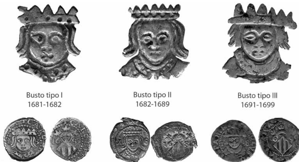
Fig. 5.- Los tres estilos representados por dihuités de 1682 (cat. 2.1), 1684 (cat. 3) y 1699 (cat. 11) .