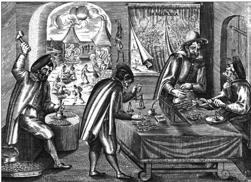
Fig. 1.- Escena de acuñación. Aunque la escena corresponde a un taller alemán del siglo XVII, las limitaciones técnicas de la época no permiten pensar en diferencias significativas respecto al trabajo que se realizaría en la ceca de Valencia ( Germanisches Nationalmuseum Nürnberg ).

La documentación relativa a estos años de acuñaciones registra importantes cantidades de plata acuñada. Durante los años 1693-1699, los marcos de plata empleados en la ceca fueron un total de 119.237, con los que se fabricaron un total de 13.711.895 piezas según la siguiente distribución por años (Mateu y Llopis, 1958: 51, 53).