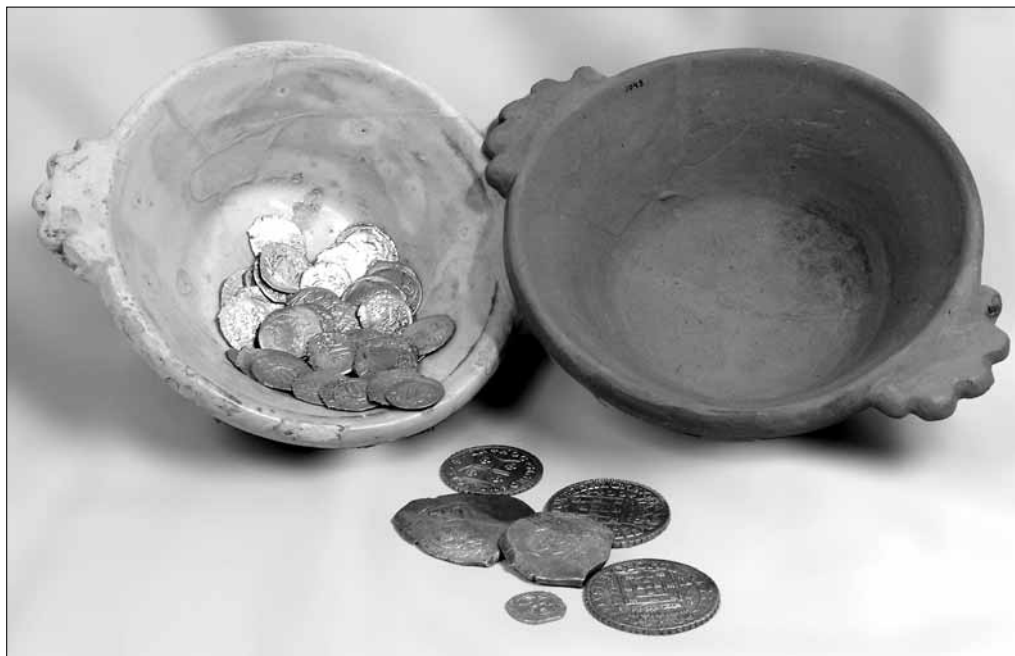
Fig. 3.- Tesoro de la calle Fos (Ayuntamiento de Valencia).