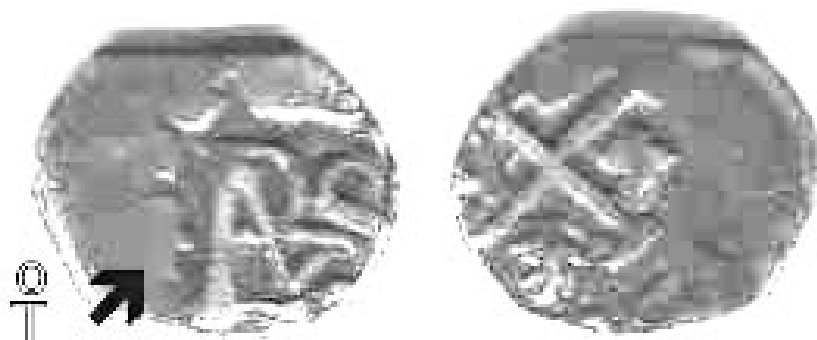
Ampliación de un ½ real en el que se observa la marca de ceca de Toledo

Aún añadiremos la imagen de otro medio real de Toledo que muestra la marca de ceca T con una 'o' encima, que corresponde a su marca oficial y que demuestra que Toledo acuñó medios reales con Felipe IV.